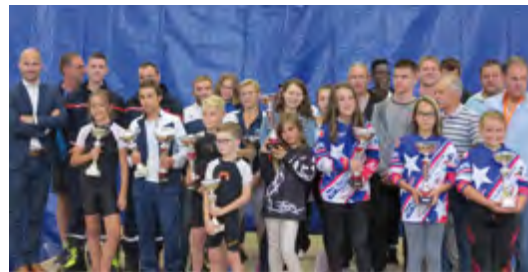
Trophée des sports

Notons aussi la présence de très nombreuses familles venues du Grand Baume et de l'ancien canton du Pays Baumoïse.