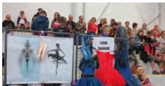
Un public venu en nombre