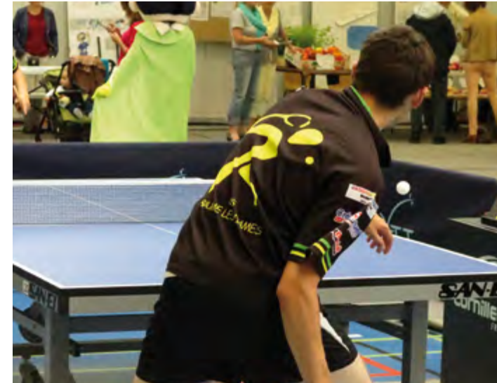
Avec l'appui de l'OIS, les sports étaient bien représentés lors du forum des associations du 2 septembre dernier.

L'OIS vous accompagne, vous les associations dans votre engagement au service de vos adhérents. À cet effet il dispose de matériel disponible en prêt, d'un fonds documentaire, de moyens de communication.