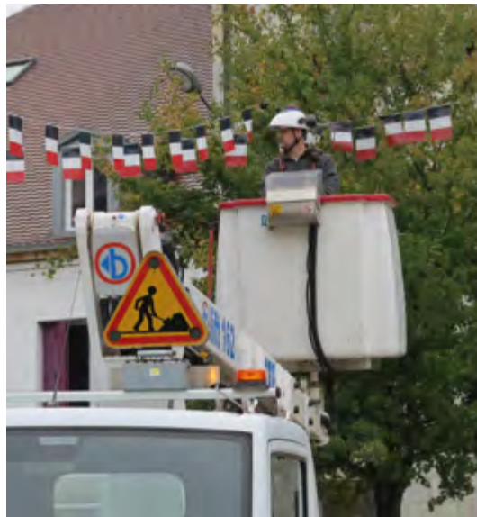
Les cérémonies engendrent aussi une phase de préparation et de désinstallation

Lorsqu'on se rend à un événement, on ne pense pas toujours au travail de préparation que cela demande. Quel que soit l'organisateur, service, association, à un moment donné, la demande transite par les services techniques qui prennent en charge la logistique nécessaire à la bonne tenue d'un événement. Les agents s'investissent en amont : ils installent, portent, branchent, moquentent, barrièrent, pour que tout soit prêt le jour J. Une fois l'événement terminé, ils rangent, nettoient, retransportent pour que tout soit à nouveau prêt pour l'événement suivant. Et c'est un éternel recommencement !