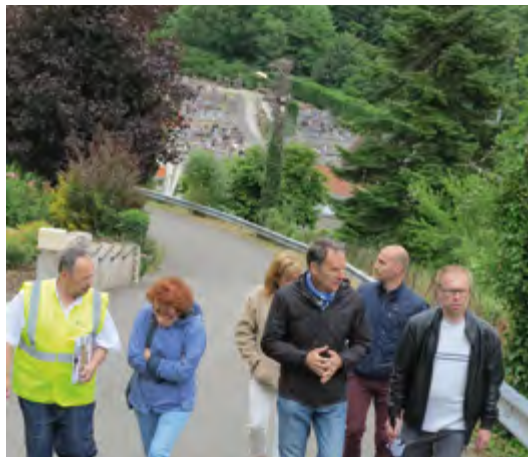
Les élus sur le terrain

Tout n'est donc pas réalisé, mais chaque demande fait l'objet d'une attention particulière des services en lien avec les élus.